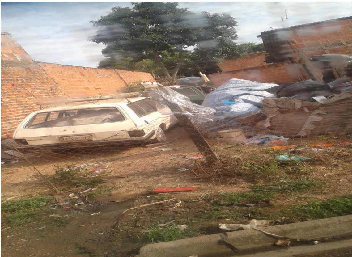
1. Casa da Rua Atoba, Novo Horizonte alojando recicláveis de forma irregular.

Em seguida, a equipe atendeu o bairro Novo Horizonte, bairro de classe baixa, com poucos comércios e quase sem casas para aluguel e venda. A equipe foi bem recepcionada e bem atendida pelos moradores. Não houve reclamação sobre a coleta, porém, os catadores autônomos são os que mais coletam os recicláveis. Inclusive, a equipe flagrou um morador do bairro, na Rua Atoba, atrás da escola municipal Irene Peron, que coleta os materiais recicláveis e aloja em sua residência de forma irregular, atraindo animais peçonhentos, gerando reclamação de todos na rua.