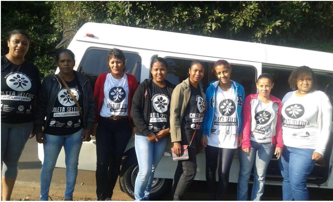
Figura 4 – Equipe de atuação no porta-a-porta