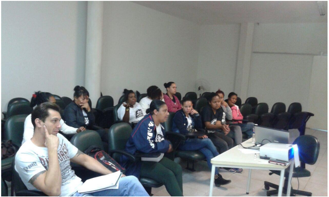
Figura 2 – Participantes do treinamento realizado pelo NEA.