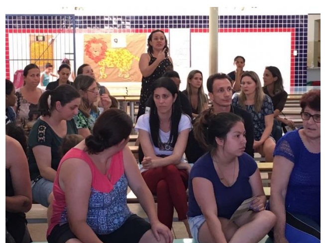
Foto 1, 2, 3, 4 e 5 – Apresentação do projeto aos pais de alunos.