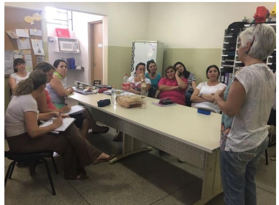
Foto 1 e 3 – Apresentação dos materiais recicláveis e não recicláveis. Foto 2 – Participação dos professores. Foto 4 – Apresentação do projeto aos professores.