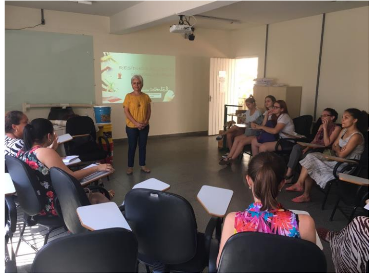
Foto 1 - Hora do Café.