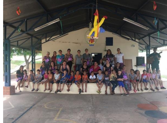
Foto 1 e 3 - Apresentação do projeto aos professores.