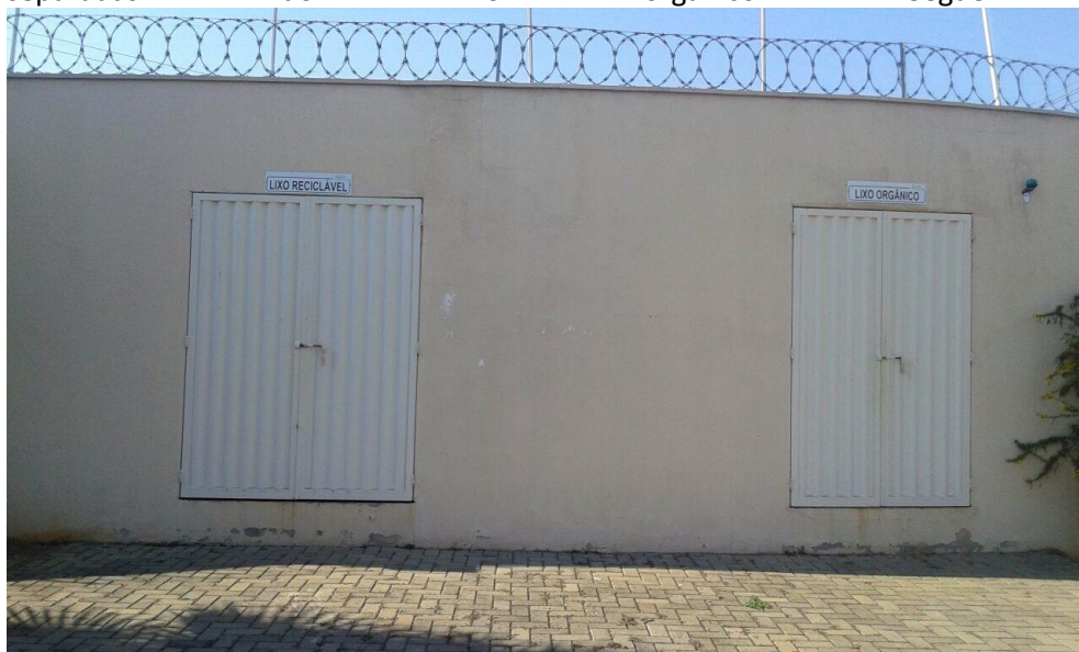
1. Fachada da lixeira da Associação de Moradores Jatobá.

Foi solicitado que a empresa passasse no Unileste, só para ser realizado nas ruas residenciais, porém, essas ruas são fechadas formando um condomínio fechado, chamado de Associação Residencial Jatobás, onde não foi permitida a entrada da equipe. O Responsável disse que já pratica a coleta, pois as lixeiras são separadas do lixo orgânico. Segue foto abaixo.