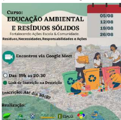
Imagem 9: Imagem da divulgação do curso realizado em 2021.

A iniciativa figura como importante proposta para o desenvolvimento dos estudantes da ESALQ e para o atendimento de demandas do município, como as previstas no Plano Municipal de Gestão Integrada de Resíduos Sólidos.