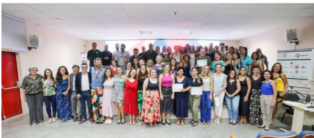
Imagem 7: Foto do evento de premiação da 4ª edição do Programa Educatrilha na Escola (2023).

Em 2023, realizou-se a 4ª edição do Programa, que contou com 25 parceiros, 29 escolas participantes e cerca de 14.000 pessoas alcançadas. O programa, patrocinado pela OJI Papéis e pela CJ do Brasil, é uma realização conjunta do Instituto de Pesquisas Ambientais (IPA), da Prefeitura de Piracicaba (através da Secretaria Municipal de Infraestrutura e Meio Ambiente de Piracicaba – SIMAP), do Laboratório de Educação e Política Ambiental (Oca/ESALQ/USP) e da Fundação Florestal (FF). A iniciativa tem, ainda, o apoio dos seguintes parceiros: Secretaria Municipal de Educação (SME), Secretaria Municipal de Ação Cultural (SEMAC), Diretoria de Ensino da Região de Piracicaba, Grupo Multidisciplinar de Educação Ambiental (GMEA), Programa Germinar, OSCIP Pira21 – Piracicaba realizando o futuro, Fundação Triunfo, Movimento Tô Aqui, Aiôn Socioambiental, Movimento pela Educação Humanizadora (MOVEH), Imafloa, Instituto Olinto Marques de Paulo (OMP) e Escola Superior de Agricultura “Luiz de Queiroz” – ESALQ (Grupo de Estudos Desafios da Prática Educativa – GEDePE, Programa USP Recicla, Grupo de estudos e práticas para o uso racional da água – GEPURA, Centro de Estudos e Pesquisa para Aproveitamento de Resíduos Agroindustriais – CEPARA, Centro de Referência em Ensino de Ciências da Natureza - CRECIN, Museu de Ciências, Educação e Artes “Luiz de Queiroz”, PET Ecologia e Núcleo de Apoio à Cultura e Extensão Universitária em Educação e Conservação Ambiental – NACE-PTECA).