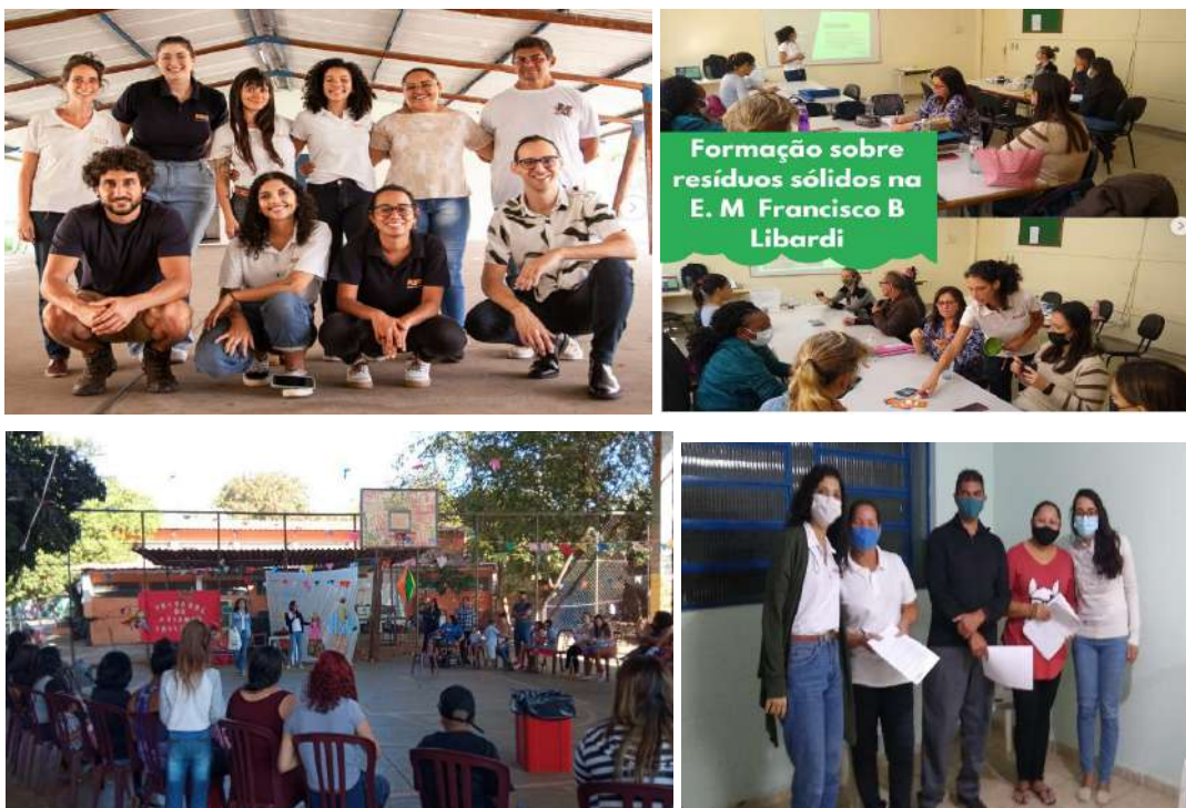
Imagens 25, 26, 27 e 28: Fotos da equipe do projeto, de formação, intervenção e reunião realizada com atores do território alcançado pelo projeto.

Instituído pela Lei n. 6.922/2010; regulamentado pelo Decreto n. 14.611/2012.