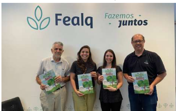
Imagem 24: Representantes do GMEA e da FEALQ registrando a doação dos livros "A árvore e seus amigos" às escolas municipais de ensino fundamental