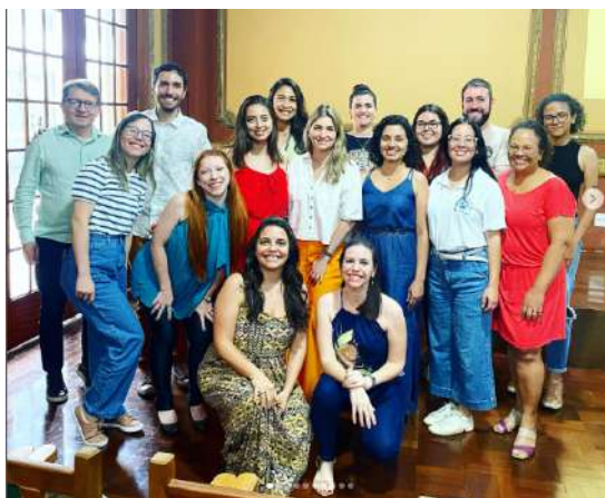
Imagem 21: Representantes do GMEA, da CIMEA e parceiros no 1o Fórum de Educação Ambiental de Ribeirão Preto.

Após a apresentação das informações, os participantes compartilharam dúvidas e reflexões, buscando contribuir com o processo de implementação da política municipal de educação ambiental de Ribeirão Preto.