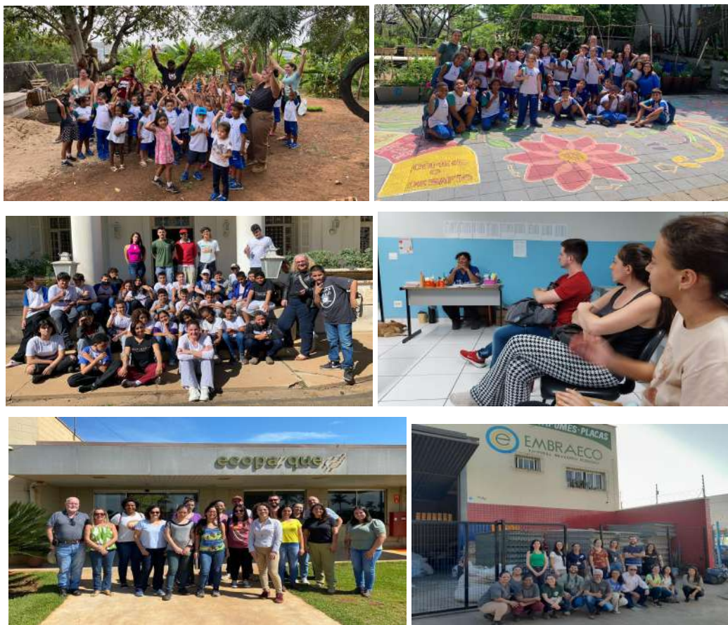
Imagens 31 a 36: Fotos de visitas educativas, realizadas no âmbito do projeto Rota dos resíduos: Percursos para a sustentabilidade, em espaços de diferentes parceiros.

Instituído pela Lei n. 6.922/2010; regulamentado pelo Decreto n. 14.611/2012.