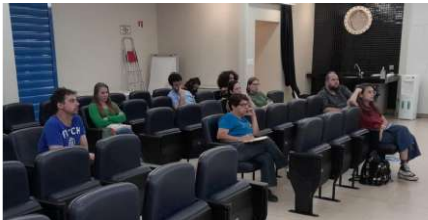
Imagem 5: Foto de reunião da COMCLIMA realizada em maio de 2023.

A comissão iniciou seus trabalhos em 30 de junho de 2021, com a eleição de sua primeira diretoria. Desde então, o GMEA participa do colegiado, estando presente nas reuniões, por meio de seus representantes. Como principais trabalhos acompanhados, no âmbito da COMCLIMA, destaca-se a elaboração da minuta de Política Municipal de Mudanças Climáticas, apresentada ao Prefeito, bem como, a elaboração do I e do II Ciclo de Eventos sobre Mudanças Climáticas, realizados respectivamente, em 2022 e 2023.