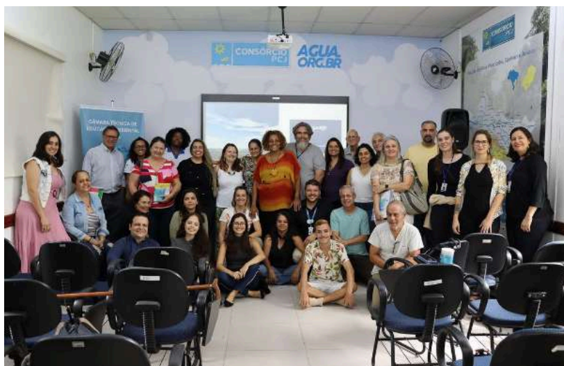
Imagem 6: Foto de reunião da CTEA-PCJ, realizada na sede do consórcio, em dezembro de 2022.

Entre os anos de 2021 e 2023, cabe destacar a participação de representantes do GMEA no GT Política da CTEA, responsável pelo processo de atualização da Política de Educação Ambiental dos Comitês PCJ.