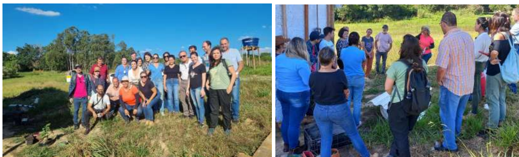
Imagens 22 e 23: Membros do GMEA e parceiros em formação sobre saneamento rural oferecida pelo Sítio Casa Mato em parceria com a SEMA.

Em maio de 2023, foi realizada, em parceria com a SEMA e o Sítio Casa Mato, localizado no bairro rural Tupi, uma atividade de campo sobre técnicas alternativas de saneamento rural. Na oportunidade, os membros do GMEA e parceiros tomaram contato com a técnica do vermifiltro, utilizada pela propriedade. Além disso, os diálogos se debruçaram sobre os principais desafios e potencialidades de uma propriedade rural para realização de ações de educação ambiental.