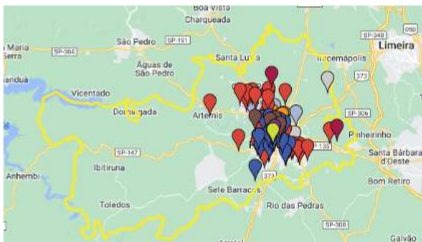
Imagem 1: Mapa resultante da atualização do mapeamento.

Todas as informações, referentes ao primeiro processo de mapeamento, bem como, ao processo de atualização do mesmo, estão disponíveis para consulta pública no site: https://gmeapiracicaba.wixsite.com/mapaea . Ressaltamos, ainda, que o processo de mapeamento é contínuo e que as iniciativas podem ser inscritas a qualquer tempo, por meio da página “contribua”: https://gmeapiracicaba.wixsite.com/mapaea/contribua .