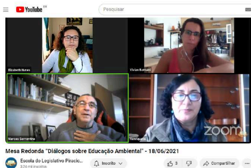
Imagem 2: Atividade disponibilizada no canal do YouTube da Escola do Legislativo Piracicaba.

Ao longo do evento, foram abordadas questões relacionadas à implementação do Plano Municipal de Educação Ambiental, aprovado por meio de decreto em 2020.