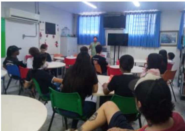
Imagem 15: Foto de atividade realizada por agricultores, no âmbito da SAPO, na Escola Estadual Hélio Nehring.

escolas municipais e estaduais, universidades, grupos comunitários, entre outros.