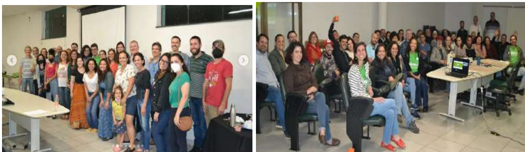
Imagens 29 e 30: Fotos da primeira e segunda Mostra Ecoar, realizadas para apresentação dos materiais educacionais produzidos ao longo do projeto.