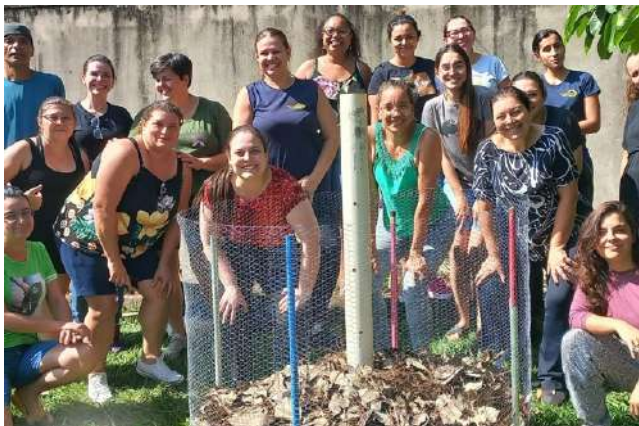
Imagem 16: Oficina “De volta à terra: compostar, plantar, nutrir”, realizada na E.M. Judith Moretti Accorsi.

de compostagem voltado às escolas de educação básica e outros espaços possíveis, a ser lançado em 2024.