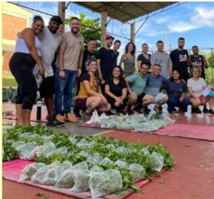
Imagem 19: Registro da organização de 166 cestas verdes entregues para 4 comunidades de Piracicaba, em outubro de 2023.

Vale esclarecer, ainda, que o Movimento Tô Aqui se cadastrou no mapeamento de ações de educação ambiental realizado pelo GMEA, tendo em vista a realização de oficinas e práticas pedagógicas sobre a temática com diferentes públicos. Diante do trabalho realizado, o Movimento solicitou uma carta de apoio do GMEA, com a finalidade de apresentação da mesma a possíveis financiadores e parceiros que possam se somar às iniciativas realizadas. A carta foi fornecida, de acordo com decisão da plenária.