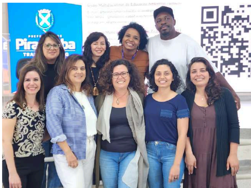
Imagem 4: Foto da equipe responsável pela condução da atividade e dos parceiros que apresentaram suas práticas.

Foram apresentados, ainda, dados referentes ao mapeamento de ações de educação ambiental, realizado pela SME, junto às escolas municipais, a partir de 4 temas geradores: recursos hídricos, resíduos sólidos, cultivo agroecológico e parques naturalizados. Após as partilhas, o público pôde participar, trazendo suas observações, perguntas e sugestões.