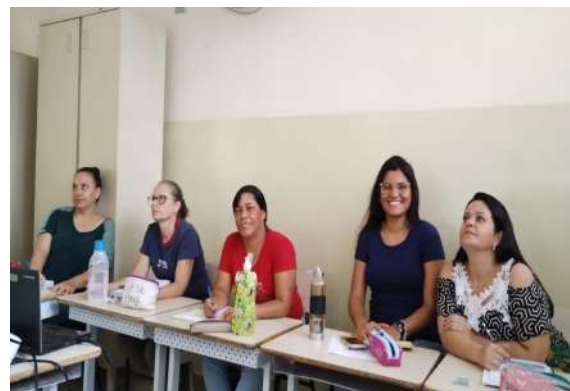
Imagens 10 e 11: Imagens da formação de professores da rede municipal, que fez parte das ações do projeto