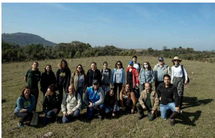
Imagem 14: Foto da visita técnica realizada na Estação Ecológica de Ibicatu.

O processo coletivo de elaboração do Programa de Educação Ambiental da Estação Ecológica de Ibicatu teve início a partir da Reunião Técnica realizada na SIMAPIRA de 2022. A partir daí, diversas instituições do poder público e da sociedade civil se envolveram com a iniciativa e têm contribuído com o processo de elaboração e redação do Programa. Além de participar das reuniões e oficinas para elaboração do documento, com o intuito de fomentar o processo de sua construção, foi realizada uma visita técnica na unidade de conservação, com apoio do GMEA e da SME, que, respectivamente, articulou e forneceu o transporte necessário. Ainda, para subsidiar o trabalho, foi realizada visita técnica no Parque Estadual de Vassununga para troca de experiências.