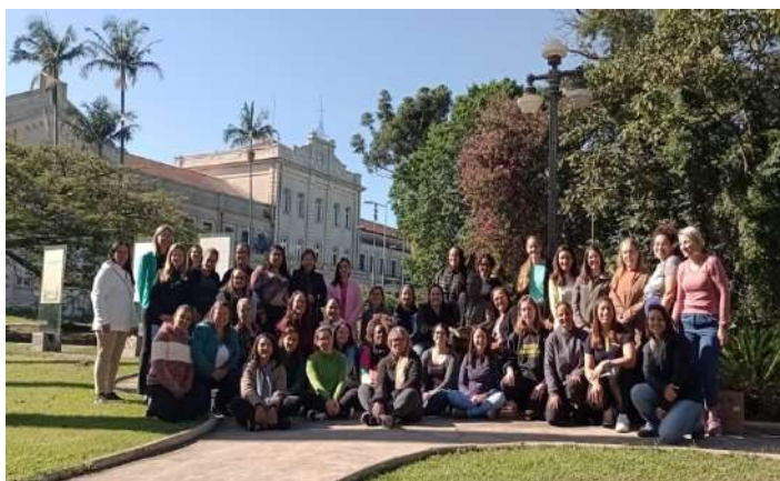
Imagem 8: Foto de atividade realizada pelo Usp Recicla, junto à educadores da rede municipal, na ESALQ/USP, em julho de 2023.

Instituído pela Lei n. 6.922/2010; regulamentado pelo Decreto n. 14.611/2012.