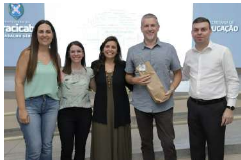
Imagens 17 e 18: Fotos da atividade realizada no anfiteatro da SME.