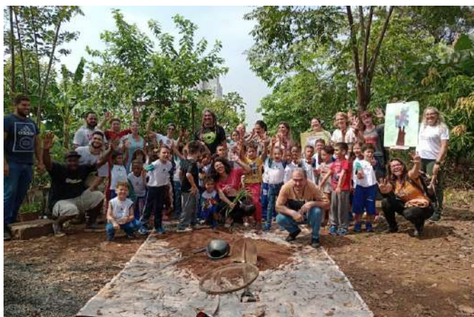
Imagem 20: Foto de atividade realizada pela Casa do Hip Hop, no âmbito da SAPO, com alunos e professores da Escola Municipal Walter Vitti.