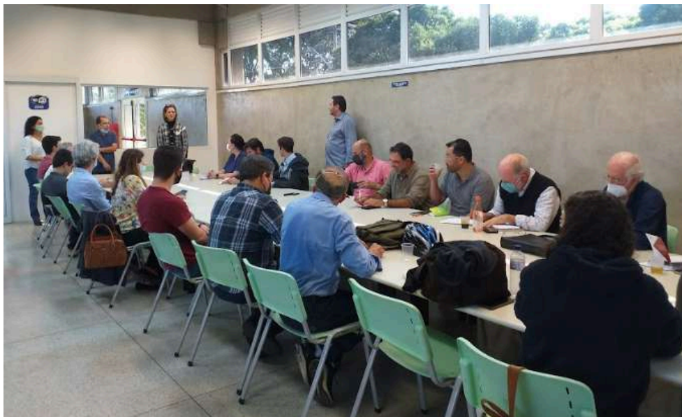
Imagem 3: Foto da reunião técnica realizada na biblioteca da FUMEP.

envolveu a definição de encaminhamentos da reunião, a partir das ideias indicadas pelos grupos.